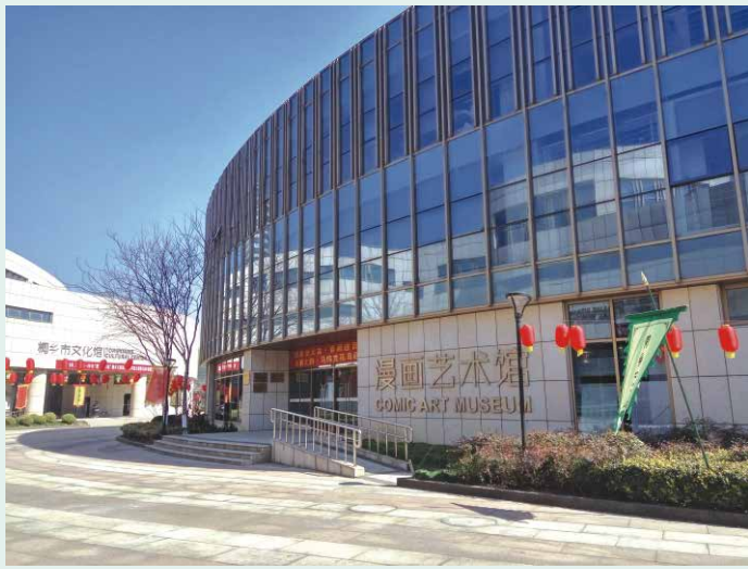
桐郷市漫画芸術館