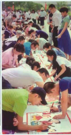
親子漫画創作体験会