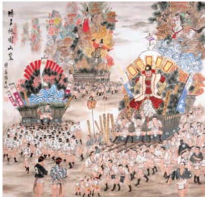
博多祇園山笠