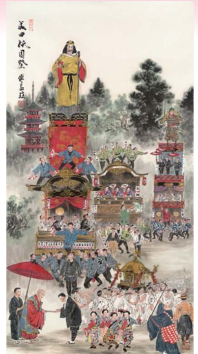
成田祇園祭