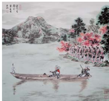
まりも祭