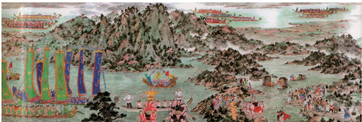
端午頌(部分) © FU EKI YOU