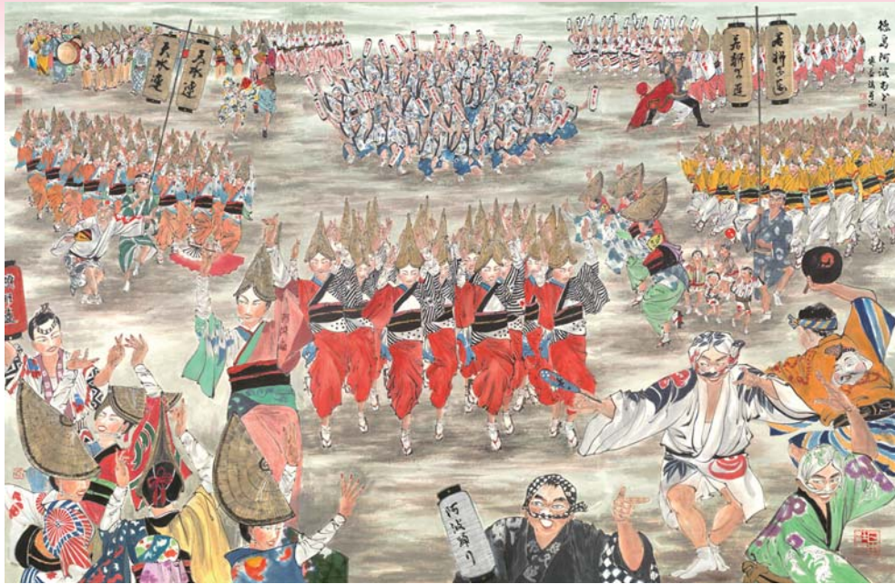
徳島阿波おどり