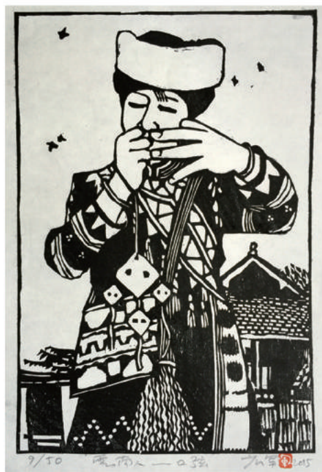
木版画「雲南人口弦」 作者 広軍